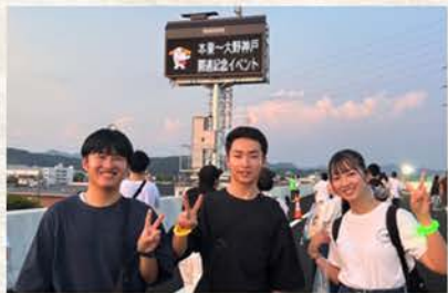
岐阜大学次世代地域リーダー育成プログラム チームMVP

このパンフレットを通して、岐阜のいちごの魅力を感じ、実際に足を運びきっかけになれば嬉しいです！岐阜大学の学生として、地域と関わりながらその魅力を発信できることに感謝し、この取り組みが地域の活性化につながることを願っています。