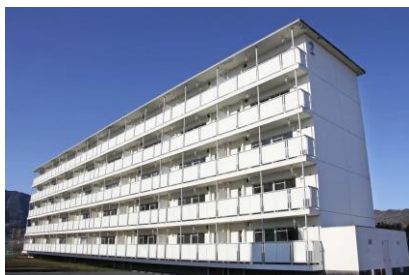
ビレッジハウス揖斐川