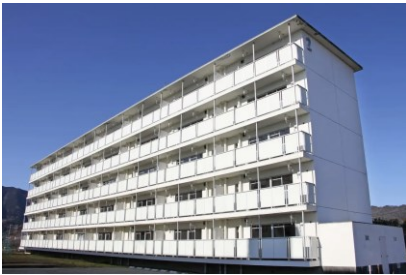
ビレッジハウス揖斐川