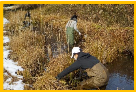
☞水路に入ってカサスゲを除去

前日の雪の影響で地面が凍結しており、当初の予定通りいかないこともありましたが、北アメリカ原産の外来種であるセイタカアワダチソウの駆除、コナラの木の伐採、沼地および用水路の清掃をそれぞれグループに分かれて実施しました。