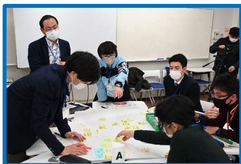
☞色々な意見を出し合って集約する

中部電力と地域協学センターの共同開催のぎふフューチャーセンターに参加しました。「ぎふフューチャーセンター」とは、様々な人々が集まる対話の場の事です。