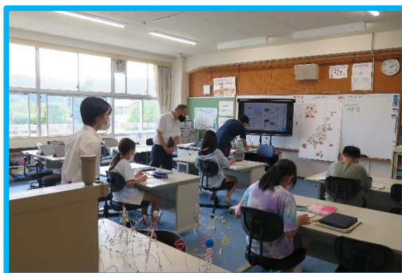
山県市の小規模小学校の見学の様子 (2021年6月23日)

こうした取り組みや広めた見聞を通して、今後も地域と協働した実践に取り組んでもらえることを期待しています。(教4・坂上)