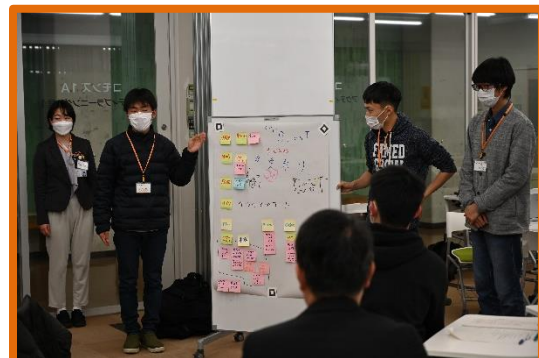
☞意見をまとめて最後に発表