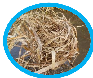
☞カヤネズミの巣を発見！ コナラの枝落とし作業☞