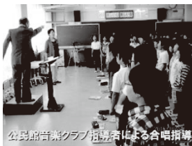
写真5 公民館活動団体による授業・授業支援の様子

【推進員の役割】公民館職員・活動団体との指導・支援内容の確認 学校との授業日程の調整