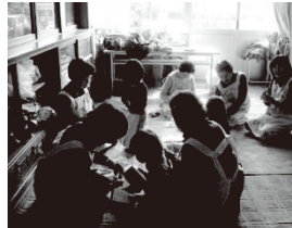
写真6 託児支援や見守り活動の様子