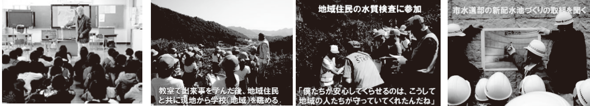
写真2 地域環境学習の様子

【推進員の役割】 市役所関係各課、学校及び支援団体と授業の指導内容及び実施時間の調整