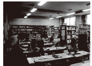
写真7 子ども教室の様子

【推進員の役割】業務支援事務 ボランティア等の募集 学校との参加児童の連絡・調整