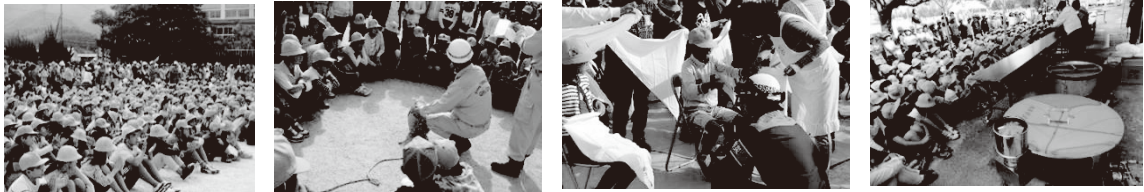
写真1 防災訓練の様子

【推進員の役割】 防災訓練実行委員会の組織化と運営、関係機関への依頼、関係団体と学校のそれぞれの活動のねらいの確認及び周知、各自治会との役割の確認、関係団体の活動内容調整、学校との時間枠調整