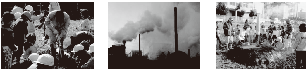
写真3 学校農園活動の様子

【推進員の役割】 関係機関への依頼、農業委員会と学校の教育課程との関連確認、栽培支援計画の調整と進捗状況確認、学校との時間枠調整、関係者との準備確認 等