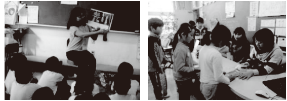
写真4 図書室運営の様子