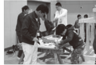
写真8 職業体験の様子

【推進員の役割】 外部講師等との交渉 活動内容・予算事務処理 学校との内容調整 等