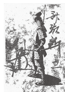
編集会議で選ばれたマンガの表紙