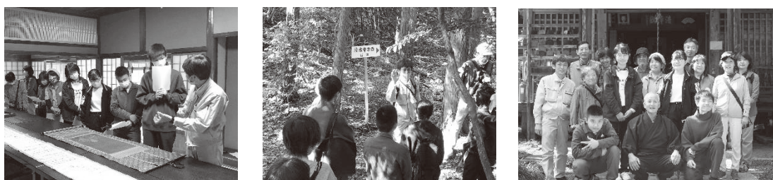
図表3 関高校地域研究部と半布里文化遺産活用協議会との合同調査の様子

その後は、それぞれに学習会を開催し、定期的に合同調査を開催した。回を重ねるごとに、活用協議会メンバーが高校生に地域の歴史を教える場面も増えてきている。