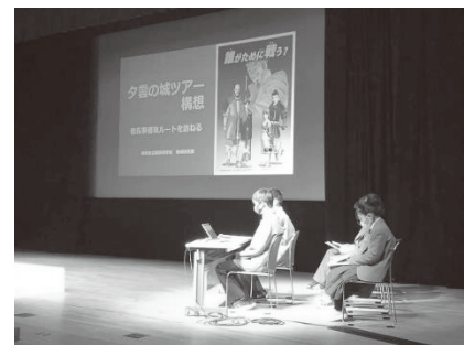
図表5 高校生の発表の様子