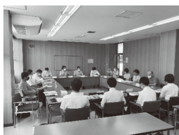
高校生を交えた編集会議